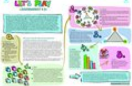
spielanleitung Lets Play JA40_web.pdf